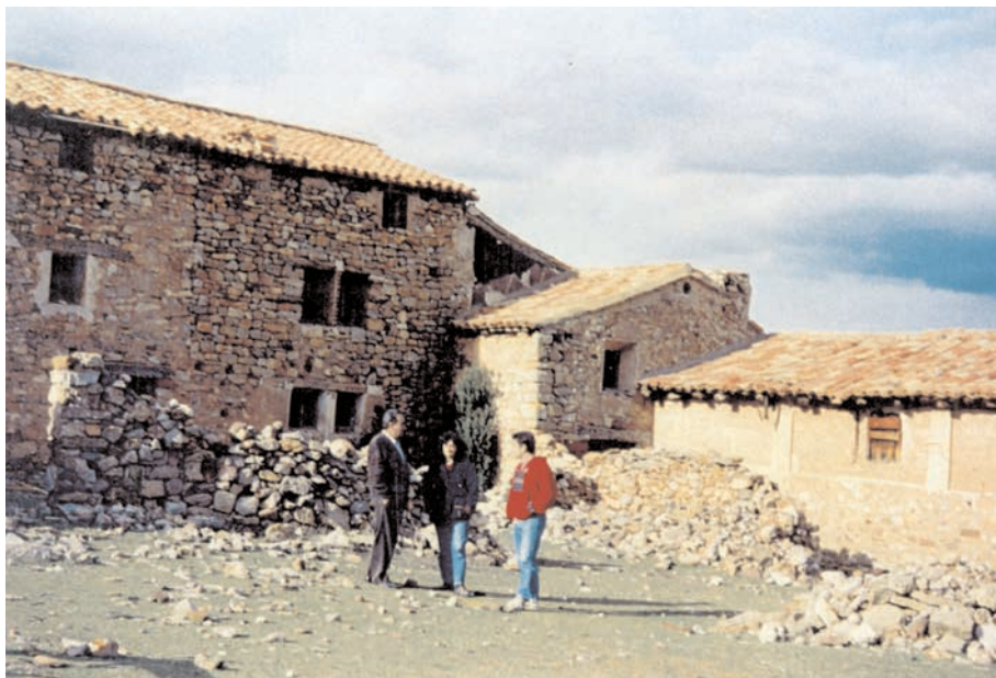
Una casa de La Laguna, lado norte Agosto 1993