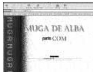
Web de Muga de Alba

Funcionario de profesión, tiene 48 años y dos hijos; una de sus aficiones es la fotografía aérea, afición que le ha permitido hacer exposiciones en la comarca y que explican las fotos de Loscos desde el aire que aparecen en la página.